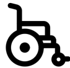
輔具及居家 無障礙環境改善